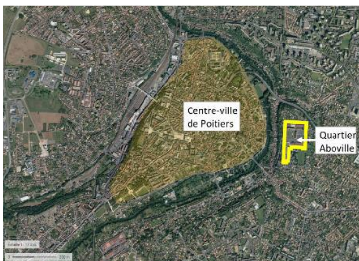
Vue aérienne – Localisation du Quartier Aboville par rapport au centre-ville de Poitiers (extrait PTD)

Au sein du Quartier Aboville, le projet est situé dans une zone réservée à l'hébergement, de manière contigüe à l'enceinte militaire historique.