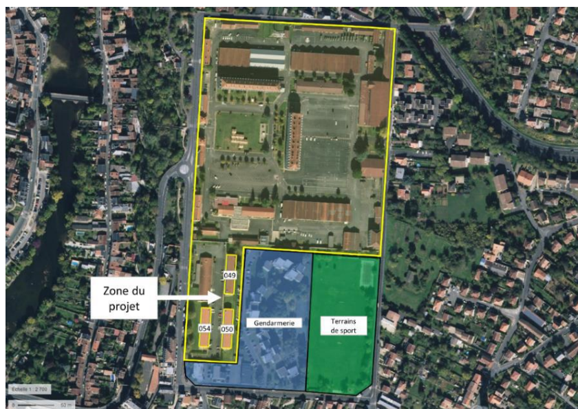
Vue aérienne – Localisation des 3 B.C.C par rapport au cœur historique du Quartier Aboville (extrait PTD)

Le Quartier Aboville occupe dans sa globalité une parcelle de 92 573m 2 de superficie.